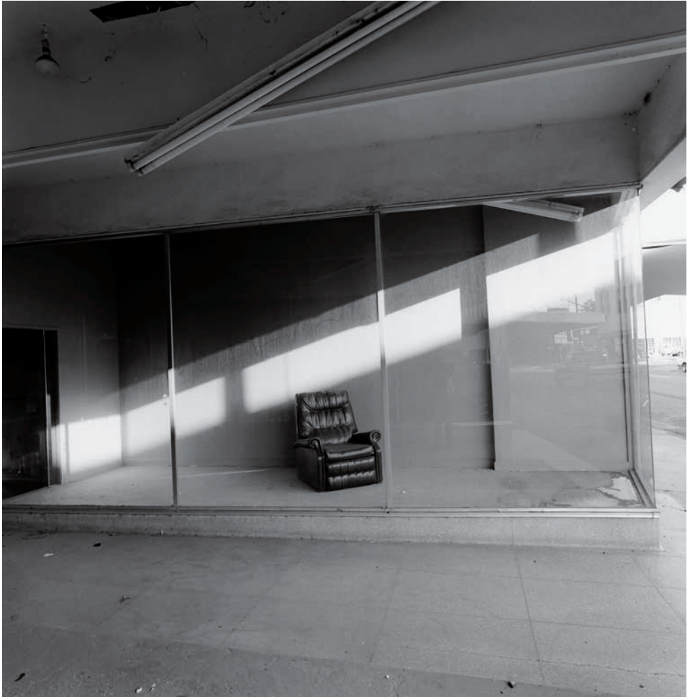
Lee Friedlander. Baton Rouge, Louisiana , 1998

jazz and photography. Following his move to New York, Friedlander reached artistic maturity in 1962 with his participation in the group exhibition The Photographer's Eye .