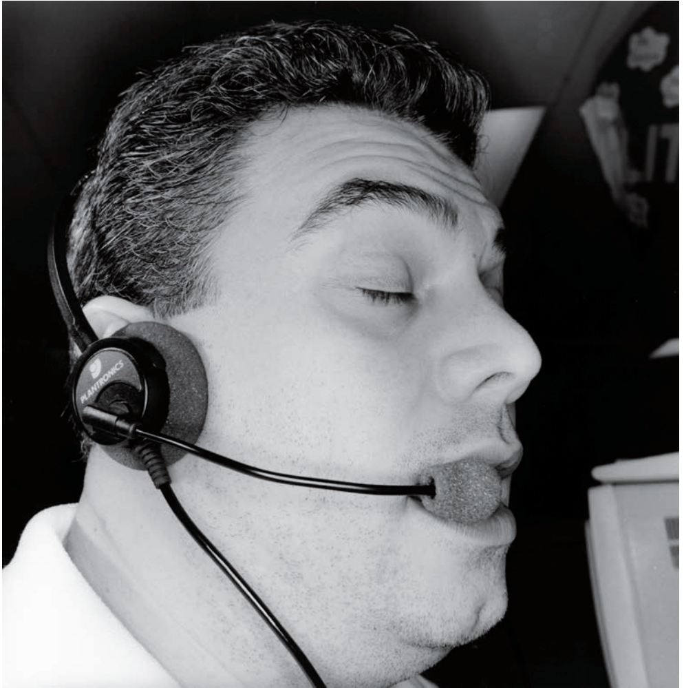
Lee Friedlander. Omaha, Nebraska , 1995

forms and the landscape. Images such as Albuquerque, New Mexico (1972) reveal his capacity to achieve a simultaneously simple and complex image; in its composition the motifs are juxtaposed like a puzzle, with the pieces seemingly fitting together naturally and inevitably and devoid of any artifice. As Nicholas Nixon perfectly summarises in his essay for the catalogue of this exhibition: "Nothing is extraneous. Nothing is missing."