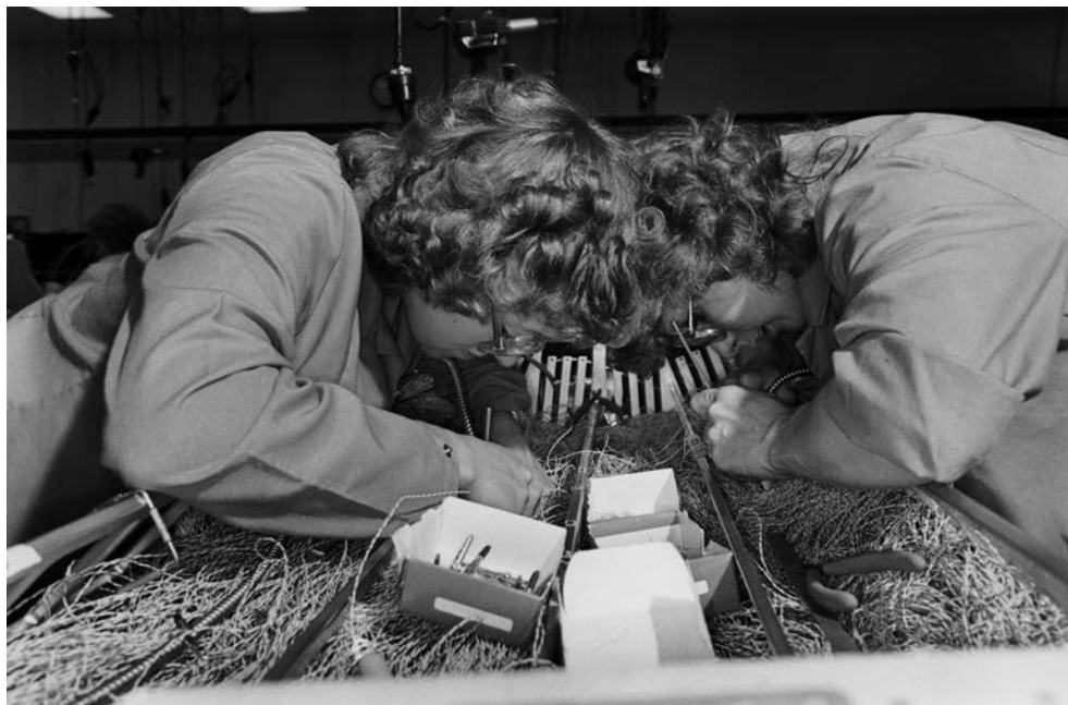
Lee Friedlander. Chippewa Falls, Wisconsin , 1986.

with greater depth of field. As a result, his landscapes now appear to broaden out and encompass the motifs, giving the compositions greater presence and emphasis. Everything is filled with light.