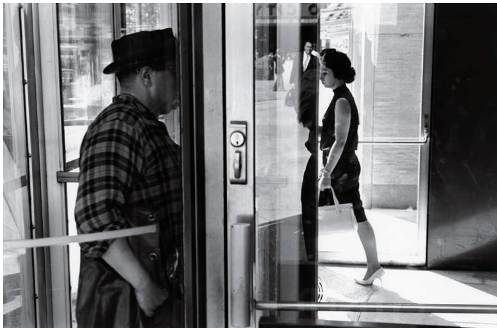
Lee Friedlander. Nueva York , 1963

A partir de una pauta cronológica, esta exposición recorre la ingente obra del artista, haciendo hincapié en determinados proyectos como The American Monument o The Little Screens , y planteando distintas asociaciones temáticas. Son unas trescientas cincuenta fotografías –diecisiete pertenecientes a las Colecciones Fundación MAPFRE– que abarcan desde paisajes urbanos o naturales a retratos y autorretratos o imágenes familiares, y que incluyen por primera vez un grupo de fotografías tomadas en España durante los años sesenta. Una amplia selección que nos acerca a la extensa e intensa obra de uno de los más influyentes fotógrafos estadounidenses del siglo xx, aún hoy activo.