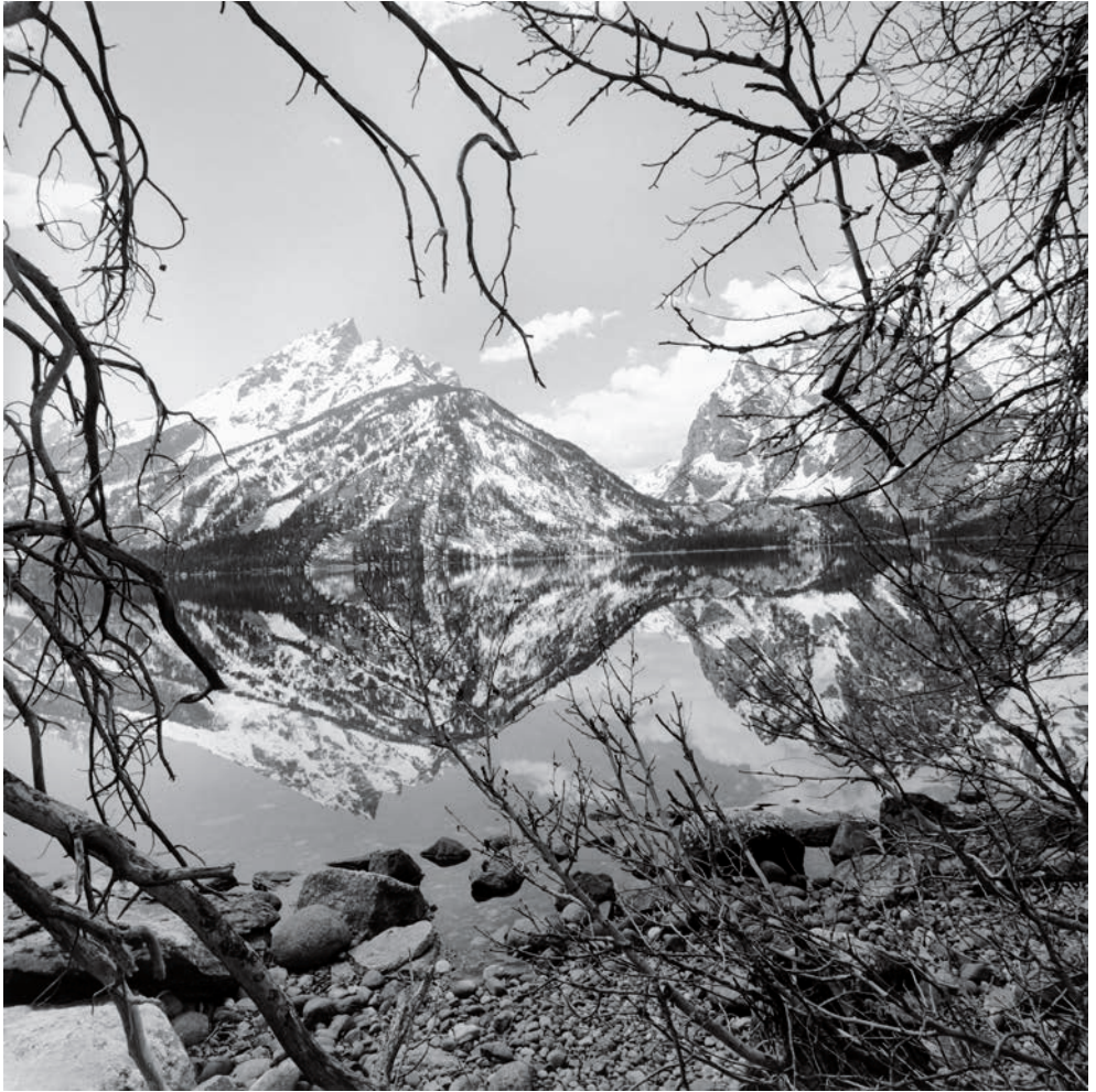
Lee Friedlander. Parque Nacional de Grand Teton, Wyoming , 1999

images such as Philadelphia (1961) and New York (1963) in which he established the bases of what would become the essential characteristics of his work. The use of shadow, reflections in shop windows and a collage-like approach to composition are some of the recurring traits that define this artist's particular style and the unique voice that speaks through his images.