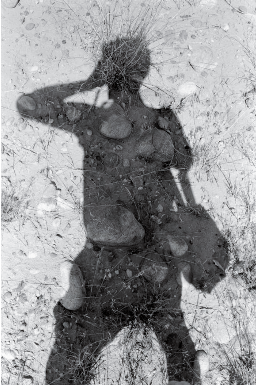
Lee Friedlander. Cañón de Chelly, Arizona , 1983