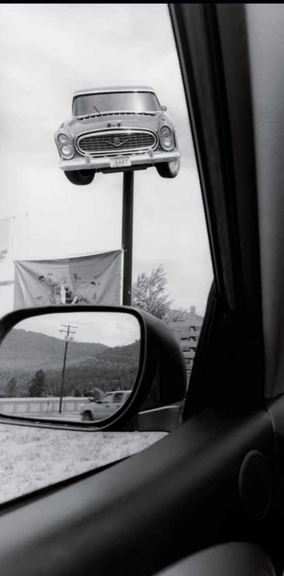
Lee Friedlander. Montana (detalle), 2008. Cortesía del artista y de Fraenkel Gallery, San Francisco