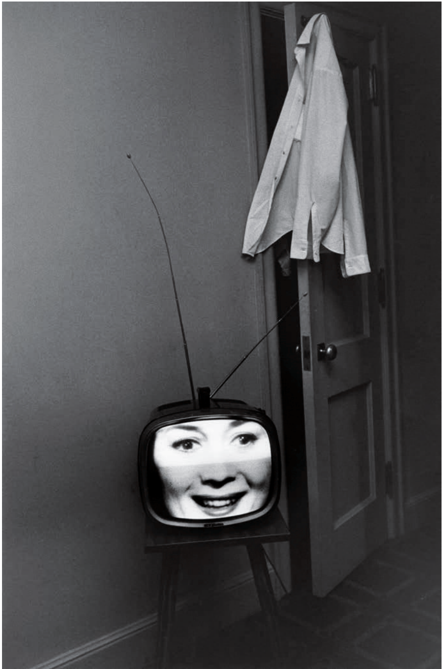
Lee Friedlander. Nashville , 1963 Colecciones Fundación MAPFRE